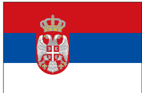
セルビア共和国大使館